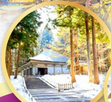
วัดชูซอนจิ