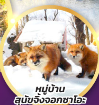
หมู่บ้าน สุนัขจิ้งจอกซาโอะ