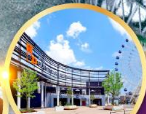
มิตซูเอาก่าเล็ตพาร์ค เซนได