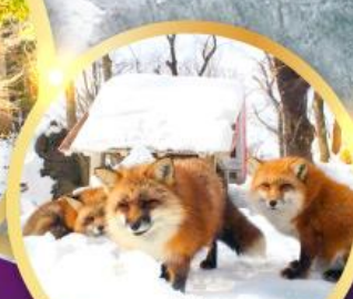
หมู่บ้าน สุนัขจิ้งจอกซาโอะ