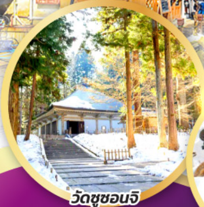
วัดชูซอนจิ