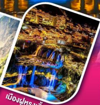
เมืองฝูหรงจิ้น