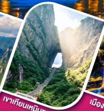
เขาเทียนเหมินชาน