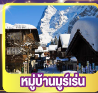
หมู่บ้านมูร์เร็น