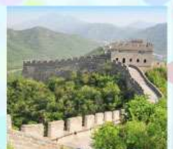
ตลาดร้อยปีเฉิงหวิงเหมียว กำแพงเมืองจีน ด้านจวิยงทวน