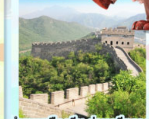
ตลาดร้อยปีเฉิงหวังเมี่ยว กำแพงเมืองจีน ด่านจวียังทวอ