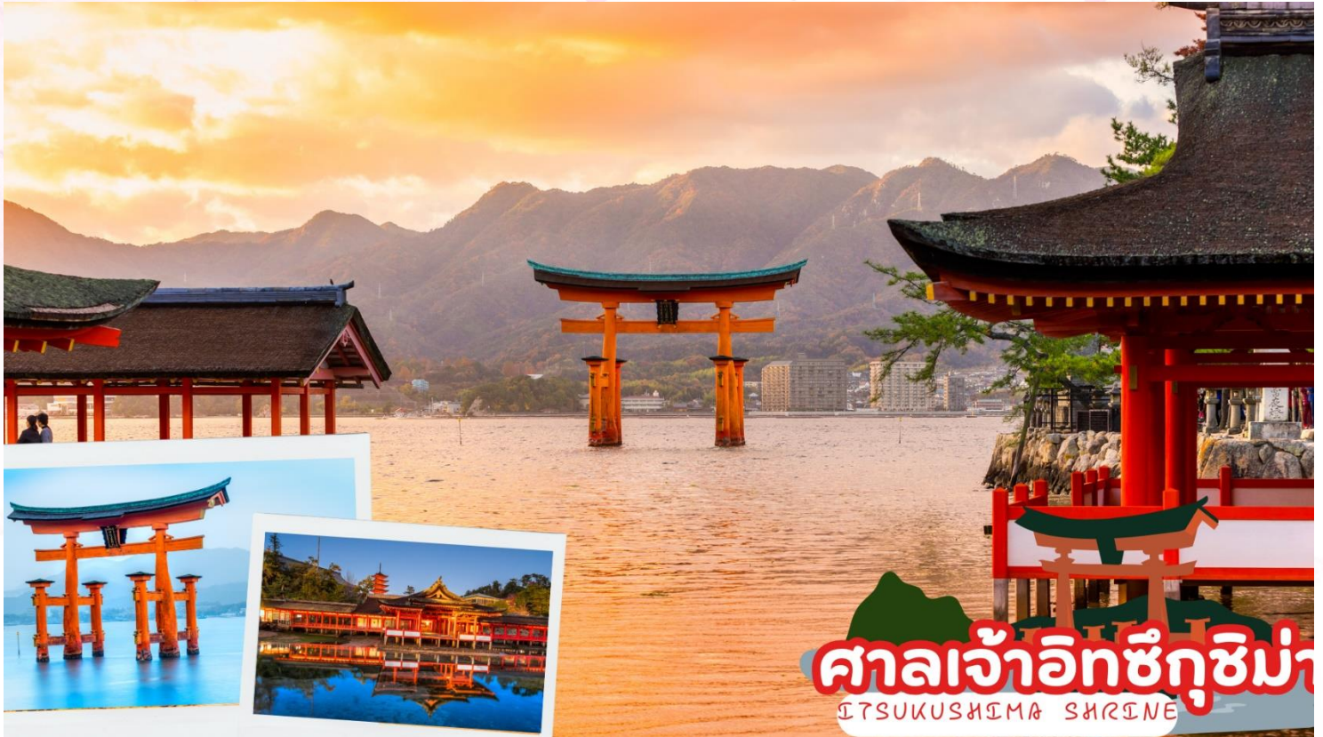
ศาลเจ้าอิซึคุชิม่า ITSUKUSHIMA SHRINE

นั่งเรือเฟอร์รี่เพื่อข้ามสู่ เกาะมียาจิม่า สถานที่ที่ได้รับยกย่องว่ามีทิวทัศน์สวยที่สุด 1 ใน 3 ของญี่ปุ่น และประตูดั้งกลางน้ำ “โอะโทริอิ” อันเลื่องชื่อ จากนั้นนำท่านสักการะ ศาลเจ้าอิซึคุชิมะ (Itsukushima Shrine) ศาลเจ้าศักดิ์สิทธิ์ที่สร้างคร่อมทั้งบนบกและในทะเล สันนิษฐานว่าสร้างขึ้นในปี พ.ศ. 1136 เพื่อบูชาเทวีแห่งท้องทะเลซึ่งเป็นธิดาสามองค์ของอะมะเทระสุเทวี ในขณะที่น้ำขึ้นเต็มทีนั้น ศาลเจ้าจะเหมือนเรือขนาดยักษ์ที่ลอยน้ำอยู่ ศาลเจ้าแห่งนี้ได้รับการขึ้นทะเบียนเป็นมรดกโลกในปี พ.ศ. 2539 และรัฐบาลญี่ปุ่นได้ยกฐานะให้เป็นสมบัติประจำชาติ