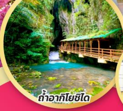
ถ้ำอากิโยชิโด