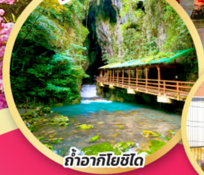
ถ้าอาทโยชิโด