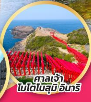
ศาลเจ้า โมโตโนสุมิฮาริ

สะพานที่สวยงามที่สุดในญี่ปุ่น สะพานคินโตเคียว