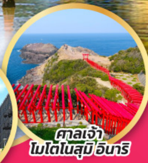
ศาลเจ้า โมโตโนสุมิอินาริ

สะพานที่สวยงามที่สุดในญี่ปุ่น สะพานคินโตเคียว