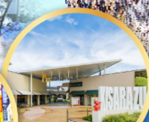
มิตซูเอะอิเกะ พาร์ค คิชะระชู