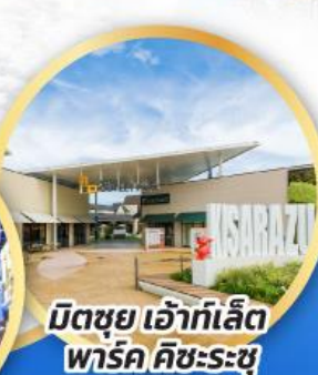
มิตรชยุ เอ้าท์เล็ต พาร์ค คิซะระซุ