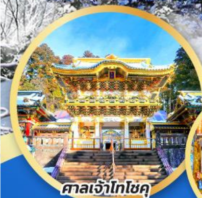
ศาลเจ้าโทโฮคุ