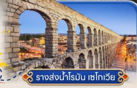
รางส่งน้ำโรมัน เซโกเวีย