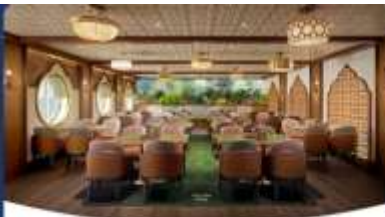
Gramma Tala Kitchen