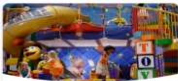
Disney's Oceaneer Club

วันนี้เรือสำราญ Disney Adventure จะล่องอยู่บนน่านน้ำสากลตลอด 2 วัน ท่านสามารถสนุกสนานพักผ่อนอยู่บนเรือสำราญที่มีกิจกรรมมากมาย ทั้ง สวนสนุกทั้ง 7 โซน ร้านอาหารธีม Disney และ Marvel ร้านขายของที่ระลึก ชมการแสดงจากหลายเวที แลพะกิจกรรมอีกมากมายทั่วทั้งเรือสำราญ