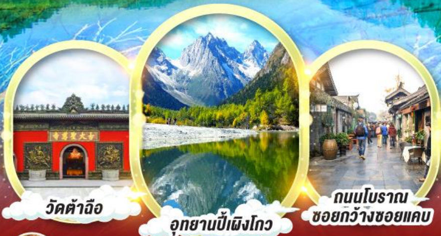
วัดต้าอือ