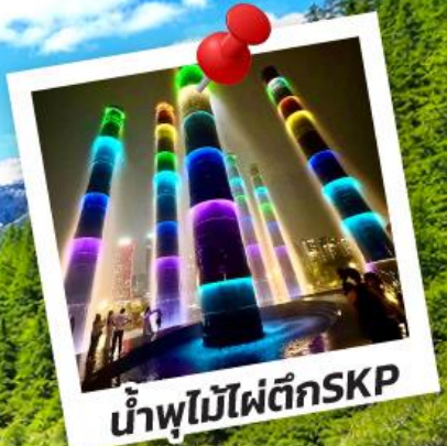
น้ำพุไม้ไฟตึกSKP

อุทยานปีเฝิงโกว อุทยานจิ้งจายโกว 6วัน 5คืน