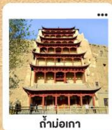
ถ้ำม่อเกา