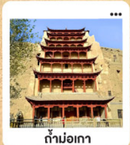
ถ้ำม่อเกา