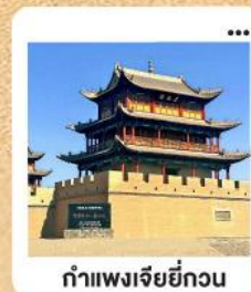
กำแพงเจียยี่กวน