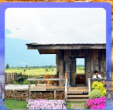
ร้านกาแฟหุบเขาคี๊อัน