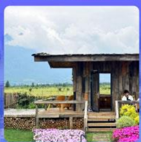
ร้านกาแฟหยุนตัน