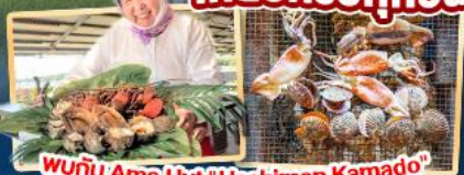
พบกับ Ama Hut "Haohiman Kamado" เมนูพิเศษ SEA FOOD