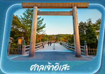
ศาลเจ้าอิสะ

เดินทาง 12 - 17 พ.ค. 69 / 19 - 24 พ.ค. 69 26 - 31 พ.ค. 69 / 2 - 7 มิ.ย. 69 9 - 14 มิ.ย. 69