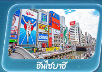
ชินไซบาชิ