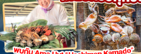
พบกับ Ama Hut "Haohiman Kamado" เมนูพิเศษ SEAFOOD

AirAsia ✈️ สายการบิน AirAsia X (XJ) น้ำหนักกระเป๋า 20 KG