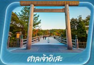
ศาลเจ้าอิเสะ