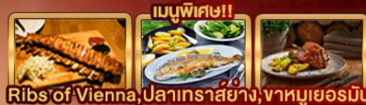
Ribs of Vienna, ปลาเทราสย่าง, จาหมูเยอรมัน