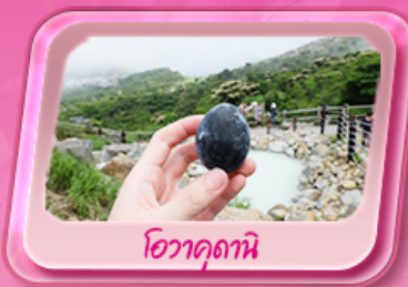
โอะวาคุดานิ

พรมสีชมพูผืนใหญ่ที่ฐานฟูจิซัง! เทศกาลชิบะซากุระ: 1 ปีมีครั้งเดียว เปิดประสบการณ์ล่องเรือโจรสลัด ตะลุยหุบเขาโอะวาคุดานิ ซิมโซ่คำ "Unseen" ขอพรด้วยหัวโขนเก่า ที่วัดมิตสึงิยาม่า โซเค็น ช้อปปิ้งจัดเต็มย่านคิงชินจูกุ และ Gotemba Outlet