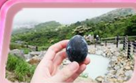
โอะวาคุดานิ

ชมสีชมพูผืนใหญ่ที่ฐานฟูจิซัง! เทศกาลซิบะซากุระ: 1 ปีมีครั้งเดียว เปิดประสบการณ์ล่องเรือโจรสลัด ตะลุยหุบเขาโอะวาคุดานิ ซิมโงะค้ำ "Unseen" ชมพรต้วยหัวโซเทเกะ ที่วัดมิตสึสึยาม่า โซเด็น ช้อปปิ้งจัดเต็มย่านคังชินจูกุ และ Gotemba Outlet