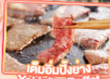
เค็มอบบิงย่าง Yakiniku Buffet