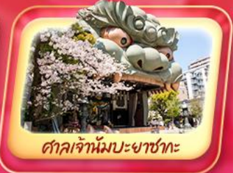
ศาลเจ้านัมบะยาซากะ