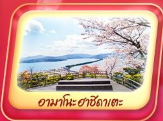
อามาโนะฮาชิดาเตะ

เดินทาง 25-29 มี.ค. 69 / 27-31 มี.ค. 69 3-7 เม.ย. 69 / 8-12 เม.ย. 69 15-19 เม.ย. 69 / 17-21 เม.ย. 69