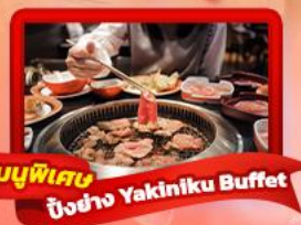
เมนูพิเศษ ปิ้งย่าง Yakiniku Buffet

เดินทาง 25-29 มี.ค. 69 / 27-31 มี.ค. 69 3-7 เม.ย. 69 / 8-12 เม.ย. 69 15-19 เม.ย. 69 / 17-21 เม.ย. 69