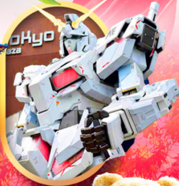
ห้างไอโดบะกันดั้ม