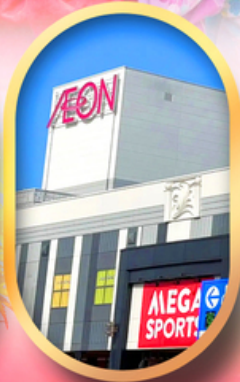
อีออนมอลล์