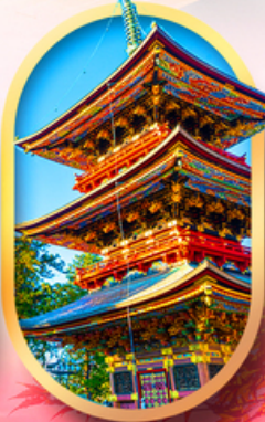
วัดนาริตะเซ็น