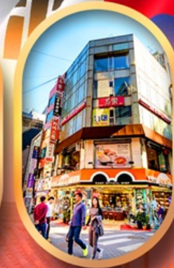
ช้อปปิ้งย่านเมียงดง