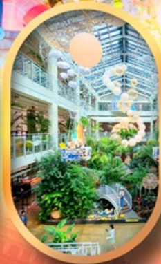
Forest Outing Cafe