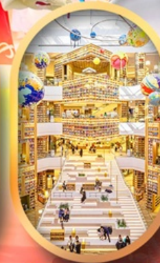
ห้องสมุดสตาร์ฟิลด์