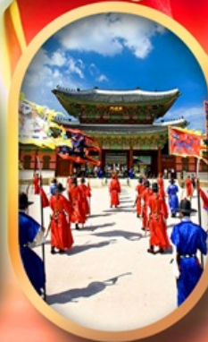
พระราชวังเคียงบก