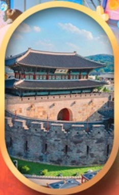
ป้อมสวาซอง