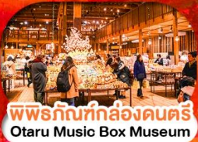
พิพิธภัณฑ์กล่องดนตรี Otaru Music Box Museum