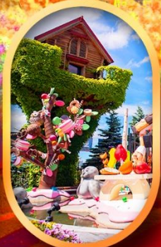
โรงงานช็อกโกแลต