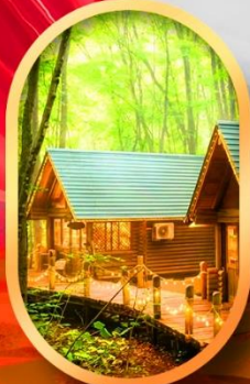
นิงเกิลเกอเรส