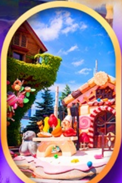
โรงงานช็อกโกแลต