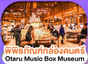
พิพิธภัณฑ์กล่องดนตรี Otaru Music Box Museum