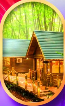
นิงเกิลทอรัส