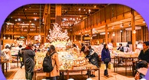
พิพิธภัณฑ์กล่องดนตรี Otaru Music Box Museum