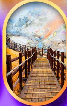
หุบเขานรกจิงคุดานิ