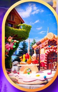
โรงงานช็อกโกแลต