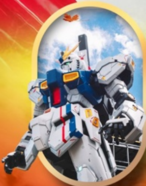
ห้างลาลาพอกันดั้ม