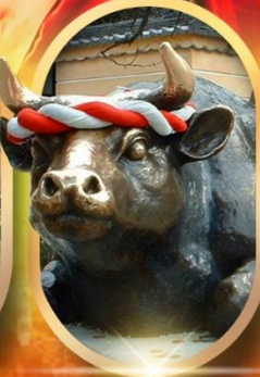
ศาลเจ้าดาไซฟุ