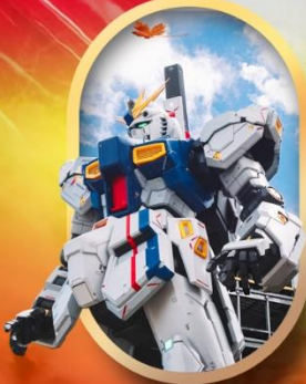
ห้างลาลาพอกันดั้ม