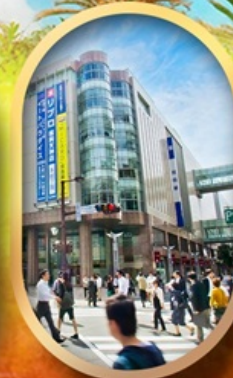
ช้อปปิ้งย่านเท็นจิน