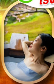
แช่บ่อออนเซ็นญี่ปุ่น