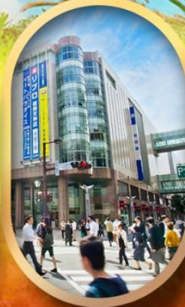
ช้อปปิ้งย่านเท็นจิน