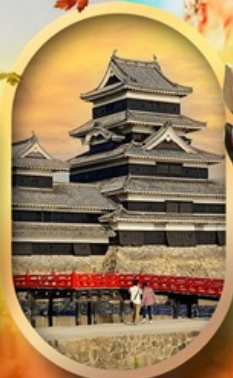
ปราสาทคุมาโมโตะ