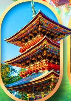
วัดนาริตะ-ซัง