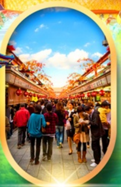
ถนนนากามิเสะ