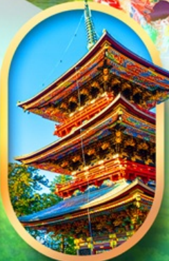
วัดนาริตะซัง