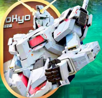
ห้างโอไดบะ-กันดั้ม