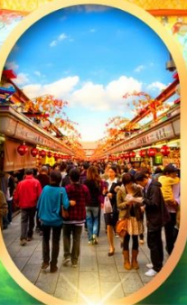
ถนนนากามิเสะ