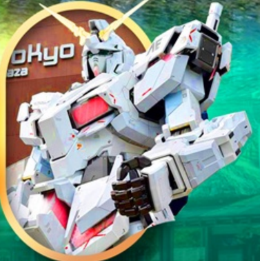
ห้างไอโดะบะกันดั้ม