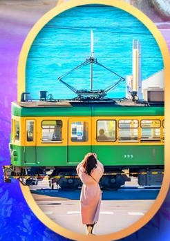
ถนนโคมาจิโดริ

✔️ ฟรี สวมใส่ ชุดยูคาตะ ถ่ายรูปเช็คอินสวยๆ