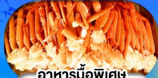
อาหารมือพิเศษ บุฟเฟ่ต์งาปู