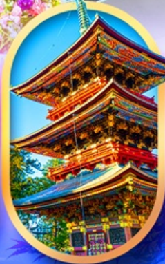
วัดนาริตะชิน