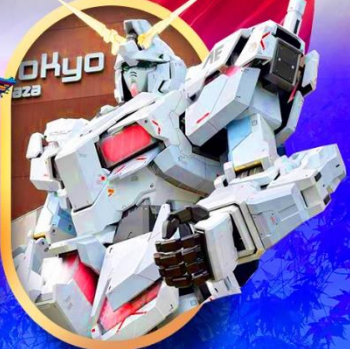
ห้างไอโดปะกันดั้ม