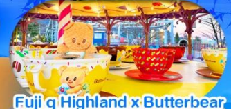
Fuji q Highland x Butterbear เดินทาง พ.ศ. 69 เป็นต้นไป