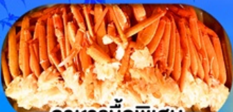
อาหารมือพิเศษ บุฟเฟ่ต์จางุ