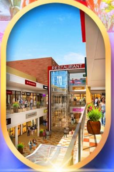
บิตซูเอาก์ลีต