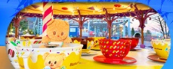
Fuji q Highland x Butterbear เดินทาง พ.ค. 69 เป็นต้นไป