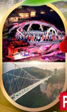
OPTION 1: โชว์นางพญาริงจอกขาว OPTION 2: สะพานแก้วจางเจียเจี้ย