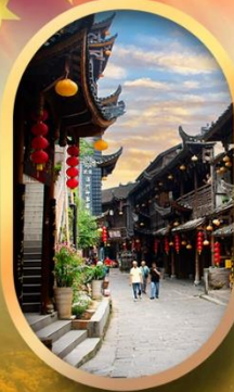
เมืองโบราณฟูรงเจิน