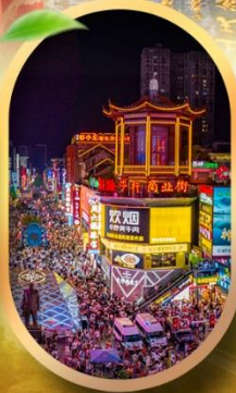
ถนนคนเดินชิงสุ่