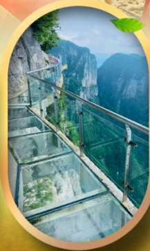
ทางเดินกระจกริมผา