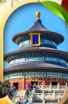
หอสังเกตการณ์เทียนถาน