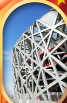
ผ่านชมสนามกีฬาโอลิมปิก