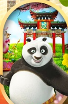
OPTION Universal Studios