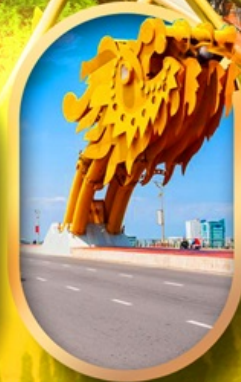
สะพานมังกรดามัง