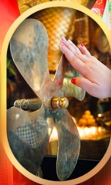
หมอนกั้งหันแซง