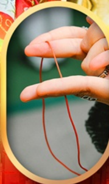
เสริมดวงความรัก