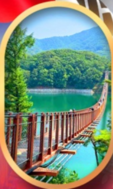
สะพานแขวนมาจิง