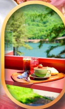
คาเฟ่ลิลกลางป่า