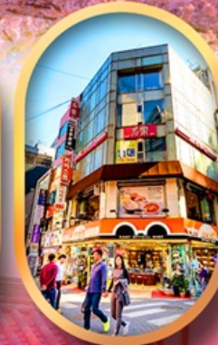
ช้อปปิ้งย่านเมียงดง