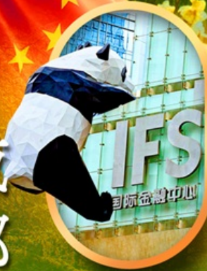
IFS หมีแพนด้าป็นตึก