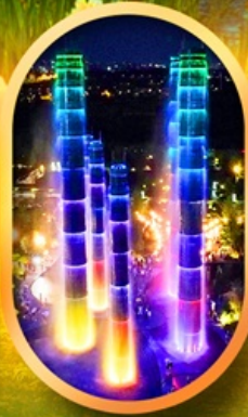
SKP Global Center