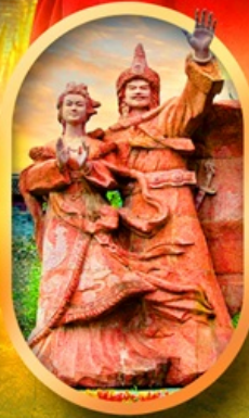
เมืองโบราณชงวาน