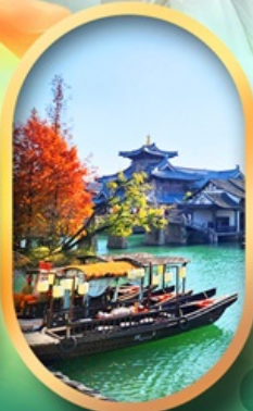
เมืองโบราณผู้หยวน