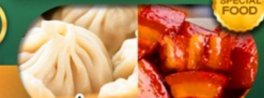
พิเศษ เสี่ยวหลงเปา หมูตงพอ เดินทาง ม.ค. - มิ.ย. 69