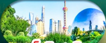
จุดเช็คอินสุดฮิต North Bund Shanghai

เซี่ยงไฮ้ หางโจว ล่องทะเลสาบซีหู ฟรีเดย์