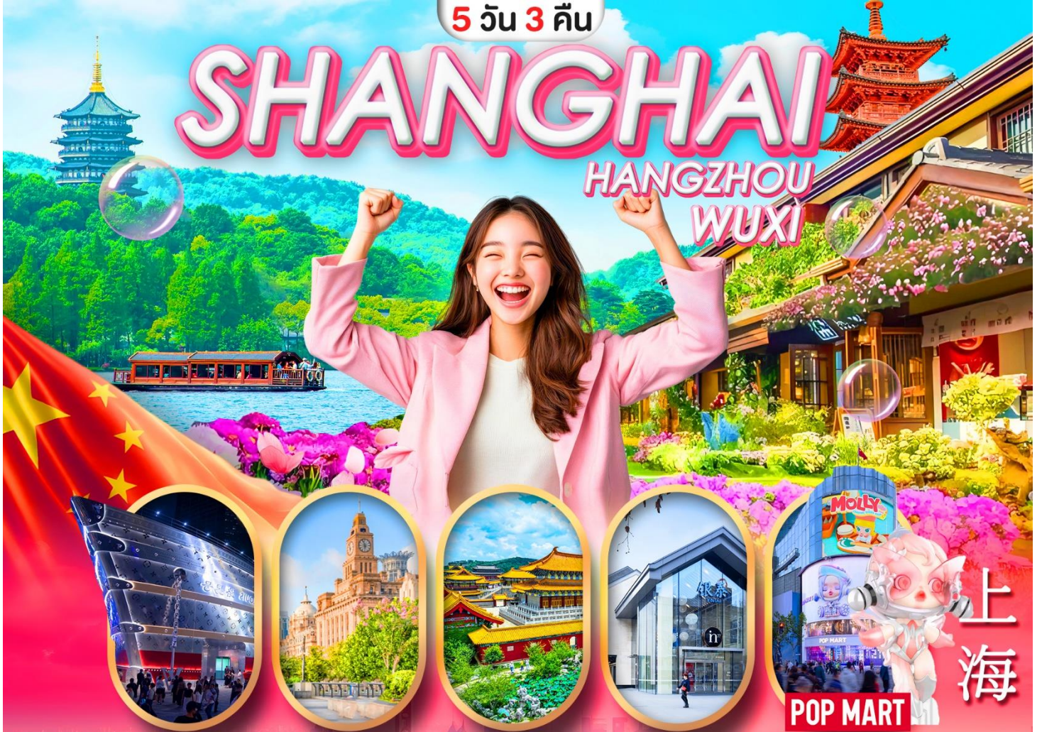
เรืออะทลุลย์