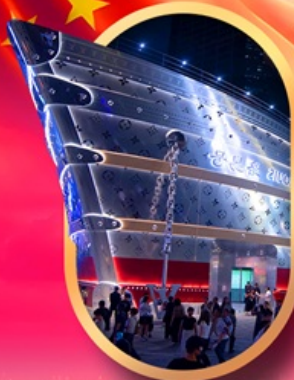
เรือเดอะหลุยส์