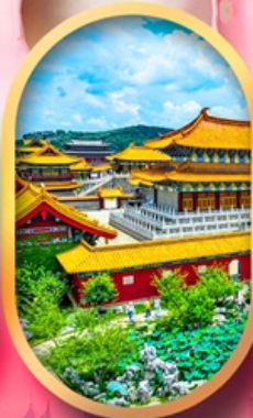
เมืองจำลองสามก๊ก