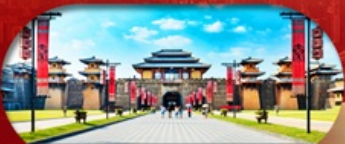
Hengdian World Studios โรงละครจำลองที่ใหญ่ที่สุดในโลก

เชียงใหม่ หางใจ หึงเตียน ล่องเรือทะเลสาบซีหู