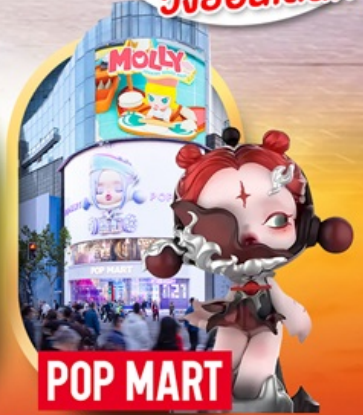
ช้อปปิ้งร้าน Pop Mart