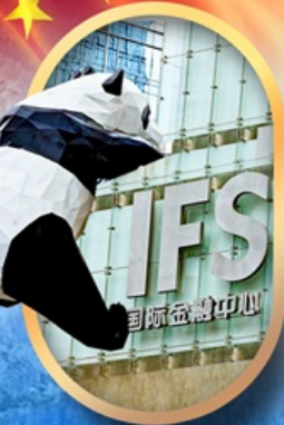
IFS หมีแพนด้าป็นตึก