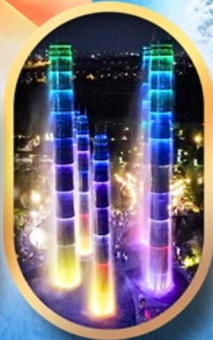
SKP Global Center