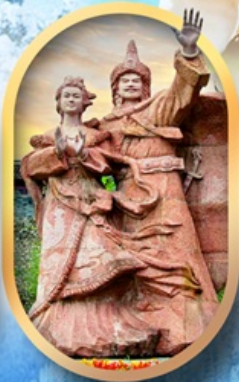
เมืองโบราณชางพาน