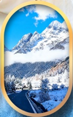
อุทยานสี่ครุณี