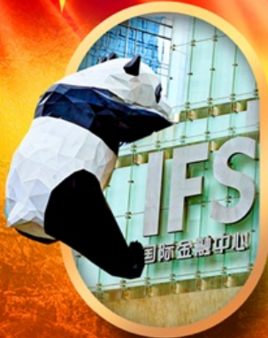
IFS หมีแพนด้าป็นตึก