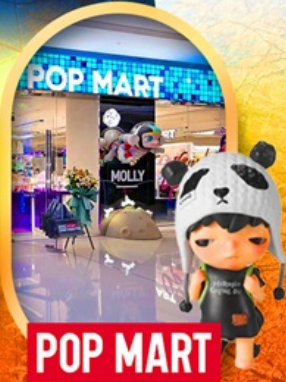
ช้อปปิ้งร้าน Pop Mart