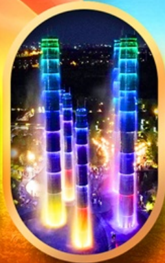
SKP Global Center