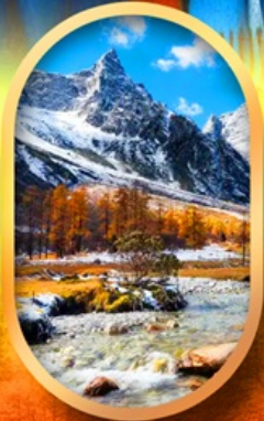
อุทยานปี้เผิงโกว