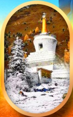
อุทยานสี่ครุณี