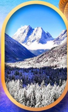
อุทยานสี่ครุณี