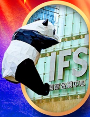
IFS หมีแพนด้าป็นตึก