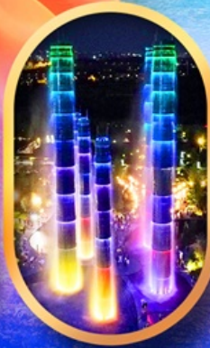
SKP Global Center