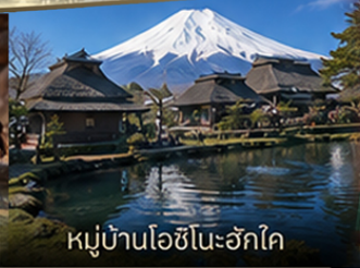
หมู่บ้านโอชิโนะอักษิโด