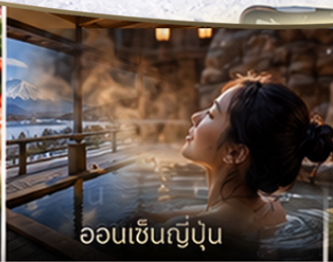
ออนเซ็นญี่ปุ่น