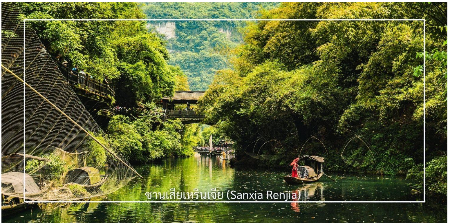
ซานเซียเหรินเจีย (Sanxia Renjia)

เช้า บริการอาหารเช้า ณ โรงแรมที่พัก (มื้อที่1)