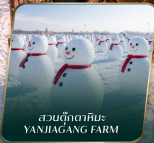
สวนตุ๊กตาหิมะ YANJIAGANG FARM