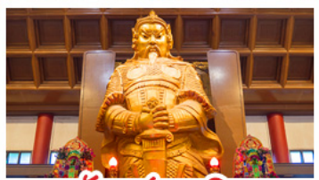
วัดซ่งกวงหมิว