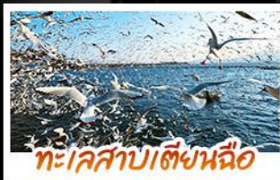
ทะเลสาบเตียนฉือ