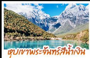
ทะเลสาบพระจันทร์สีน้ำเงิน