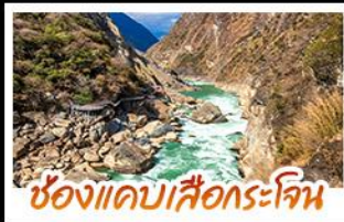
ช่องแคบเสือกระเจิน

ชมโค้ง S ทะเลสาบเอ๋อไห่ พร้อมจุดถ่ายรูปชิคๆ • สัมผัสประสบการณ์ ชมวิวบนรถไฟแบบพาโนรามาที่ LIJIANG SNOW MOUNTAIN SIGHTSEEING TRAIN • ชมโชว์ IMPRESSION LIJIANG เมืองโบราณไปซาที่รับกามเทพยุคโบราณ (รวมค่าเครื่องดื่มกำละ 1 แก้ว) นั่งรถไฟความเร็วสูง 1 เที่ยว จากลี่เจียงกลับสู่คุนหมิง เต็มอ้อมกอดบึงของผาถ้ำ ถนนหนานฉิงเซีย ประตูน้ำทองไถ่หยก