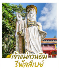
เจ้าแม่กวนอิม รัฟัสส์เบย์