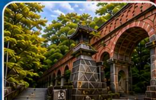
วัดนินเซ็นจิ