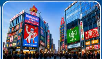
ช้อปปิ้งย่านชินไซบาชิ