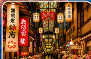
ตลาดปลานิชิกิ