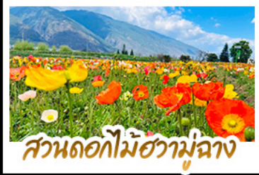
สวนดอกไม้ฮามูตาง