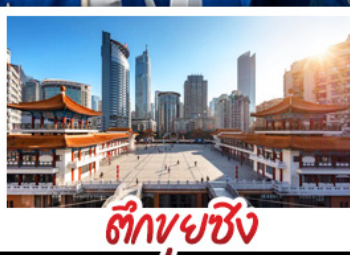
ตึกพวยซิ่ง