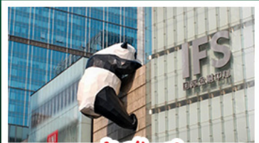
แพนด้าป็นตัก IFS

พระพุทธรูปเล่อซาน - จินฝ่อซาน - รถไฟฟ้าทะลุคัง อุ๋หลง - แพนด้าป็นตัก IFS