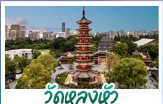
วัดเลงฮั่ว