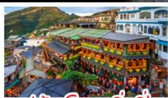
หมู่บ้านโบราณจิ่วเฟิ่น