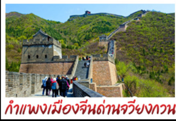
กำแพงเมืองจีนด้านจวิงกวน

UNIVERSAL STUDIO BEIJING DISNEYLAND SHANGHAI รถไฟความเร็วสูง - ถ่ายรูปทอโม่ทุก ท่าแพงเมืองจินด้านจวิงกวน มือพิเศษ เปิดปักกิ่ง, สุกี่หม้อไฟ BUFFET