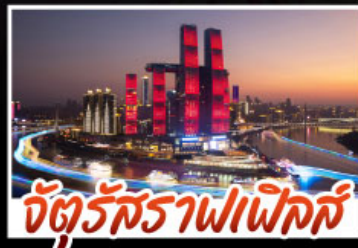
จัตุรัสราฟาเอลิส