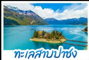
ทะเลสาบปาซง

รถไฟสายหลังคาโลก พระราชวังโปตาลา วัดโจคัง - ทะเลสาบปาซง พระราชวังฤดูร้อนนอร์บูลิงคา