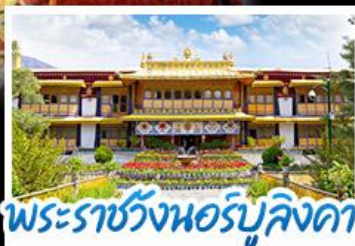
พระราชวังนอร์บูลิงคา