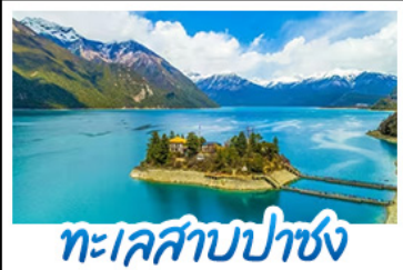
ทะเลสาบปาซัง

รถไฟสายหลังคาโลก - พระราชวังโปตาลา วัดโจคัง - ทะเลสาบปาซัง พระราชวังฤดูร้อนเนอร์บูคิงดา